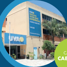
CAMPUS CABO FRIO